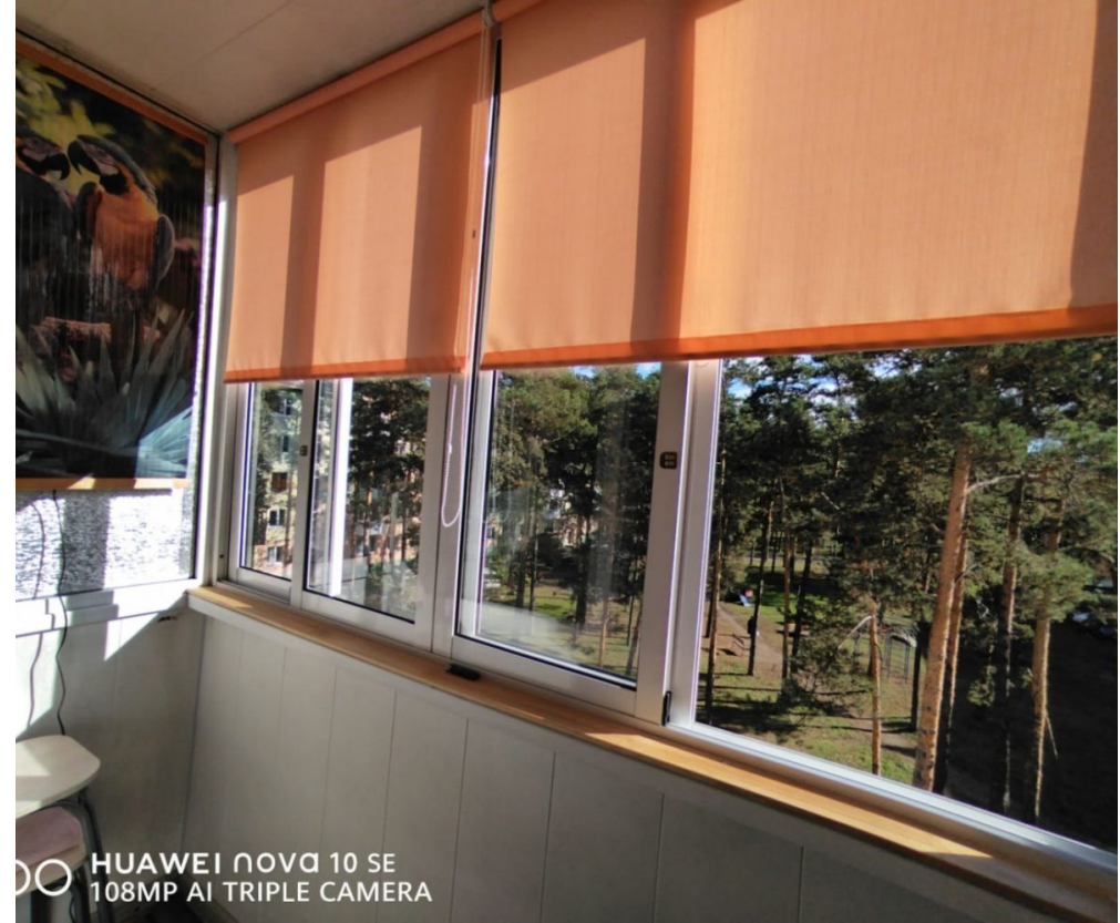
HUAWEI nova 10 SE 108MP AI TRIPLE CAMERA