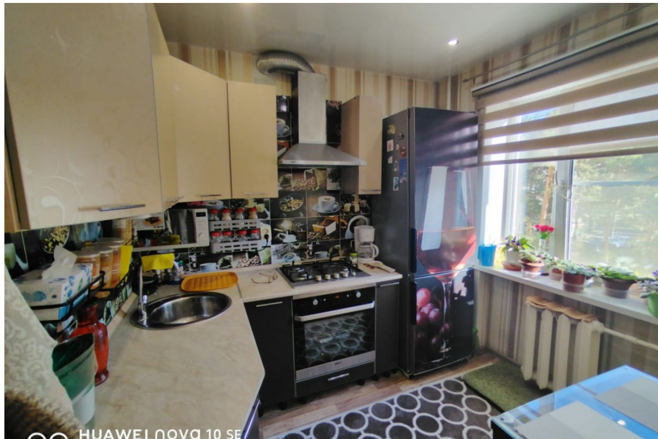
HUAWEI NOVA 10 SE