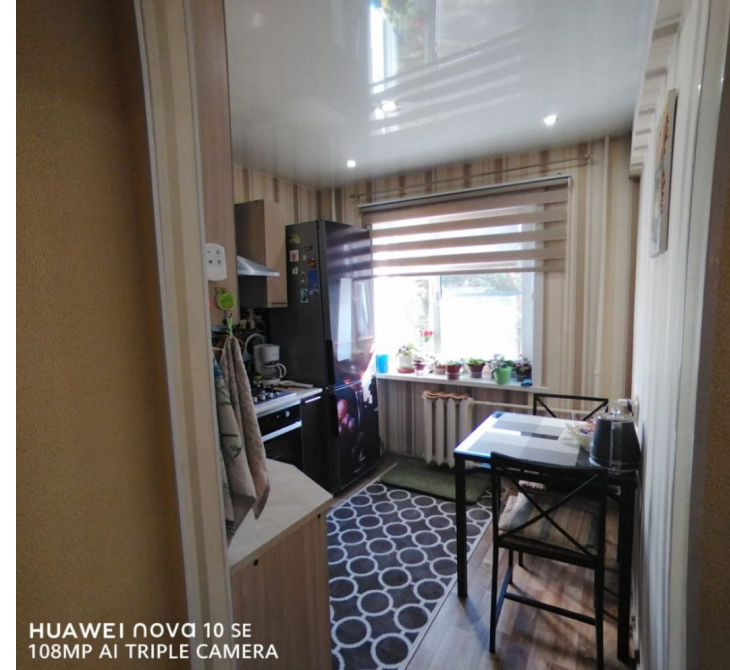
HUAWEI NOVA 10 SE 108MP AI TRIPLE CAMERA