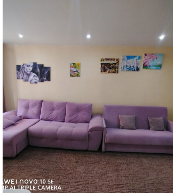
HUAWEI NOVA 10 SE 108MP AI TRIPLE CAMERA

Представляю Вашему вниманию однокомнатную квартиру в ликвидном районе нашего города. АДРЕС: 92 квартал, дом 3 ОПИСАНИЕ: на 4 этаже пятиэтажного дома, площадь 30,8 , кухня 6 м2 СОСТОЯНИЕ: светлая, уютная квартира на одну сторону, солнечная и теплая. Окна ПВХ, потолок везде натяжной, на полу линолеум, в комнате ковровое покрытие. Входная дверь качественная евро Россия. Подъезд в хорошем состоянии, металлическая дверь с домофоном. В квартире остается: В кухне: кухонный гарнитур с встроенной плитой и вытяжкой. В комнате: шкаф-купе, 2 дивана, комод, журнальный столик, полка. В прихожей: зеркало. В ванной комнате: навесной шкаф с зеркалом. ИНФРАСТРУКТУРА: в шаговой доступности различные магазины, кафе и аптеки. Детский сады № 9, школа № 6. Автобусная остановка маршрут № 2, 8, 10. Квартира без долгов, ограничений и обременений!