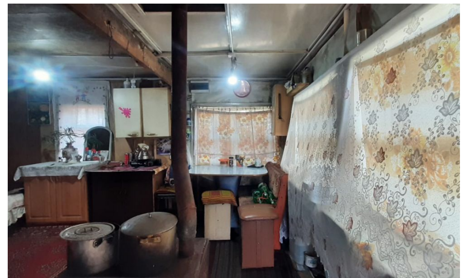
Общая площадь: 30 м 2 Количество этажей: 1