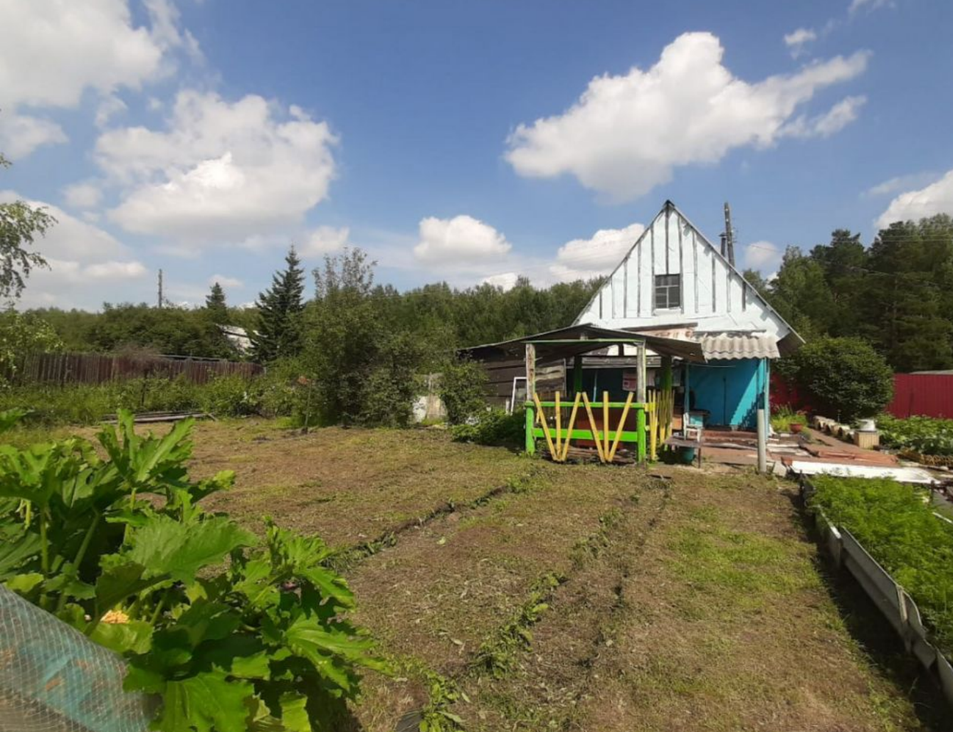
Тип объекта: дача Площадь участка: 6 сот.